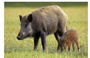
Unsere Jäger: Gustav Rörich Winterbach